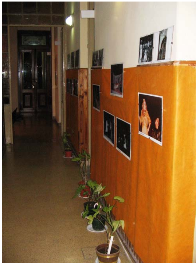
Segunda Muestra de las Artes Escénicas 2007