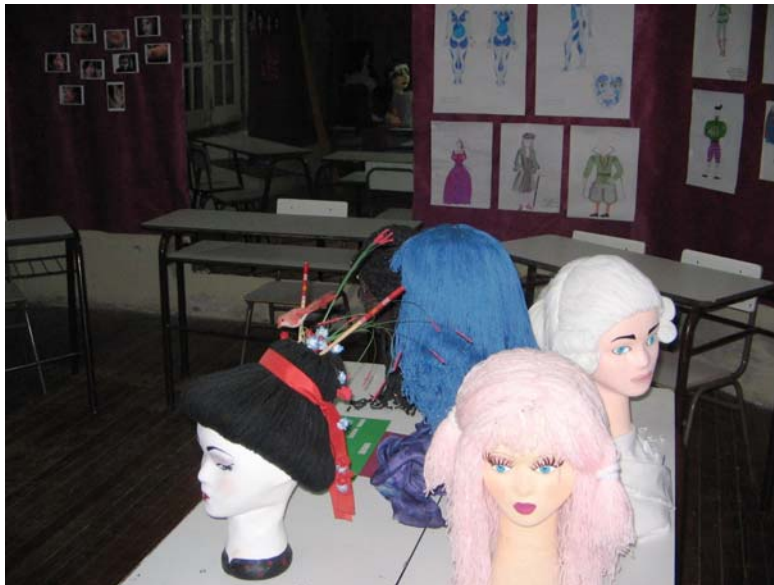
Tecnicatura en Maquillaje (Segunda Muestra de las Artes Escénicas 2007)