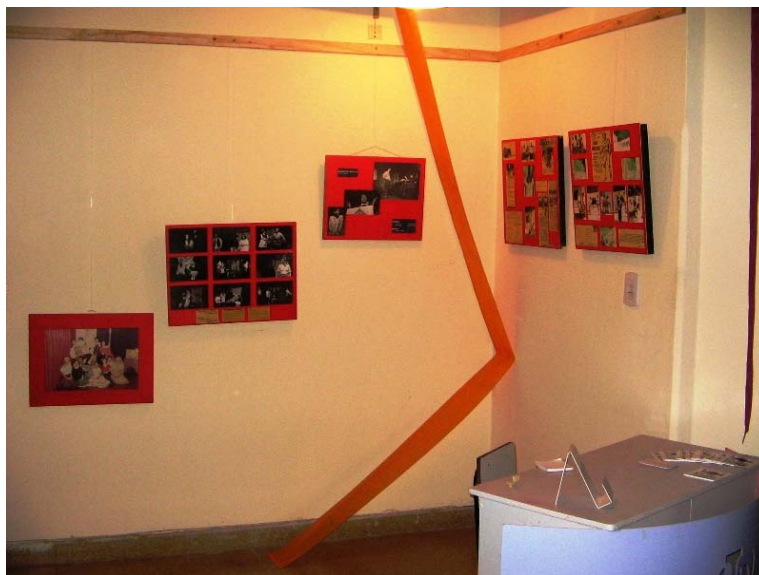
Segunda Muestra de las Artes Escénicas 2007