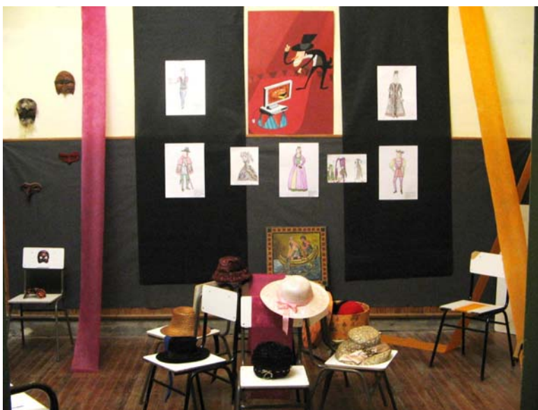
Tecnicatura en Escenografía (Segunda Muestra de las Artes Escénicas 2007)