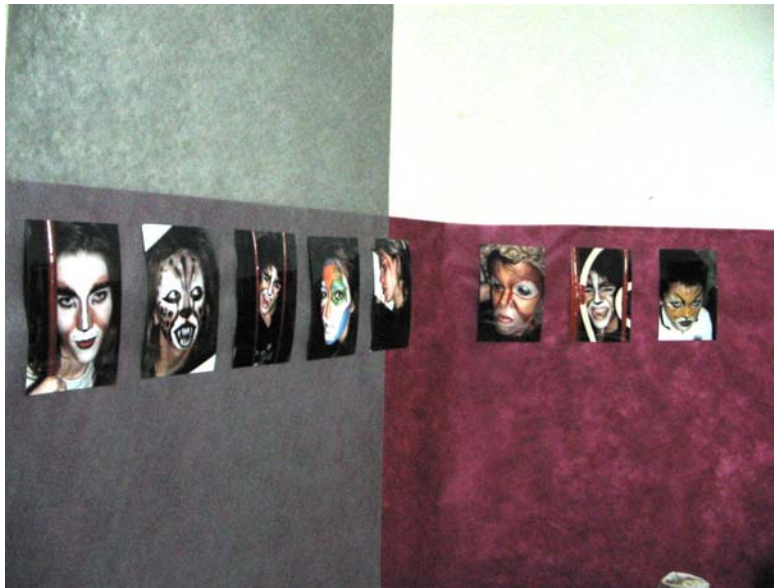
Tecnicatura en Maquillaje (Segunda Muestra de las Artes Escénicas 2007)