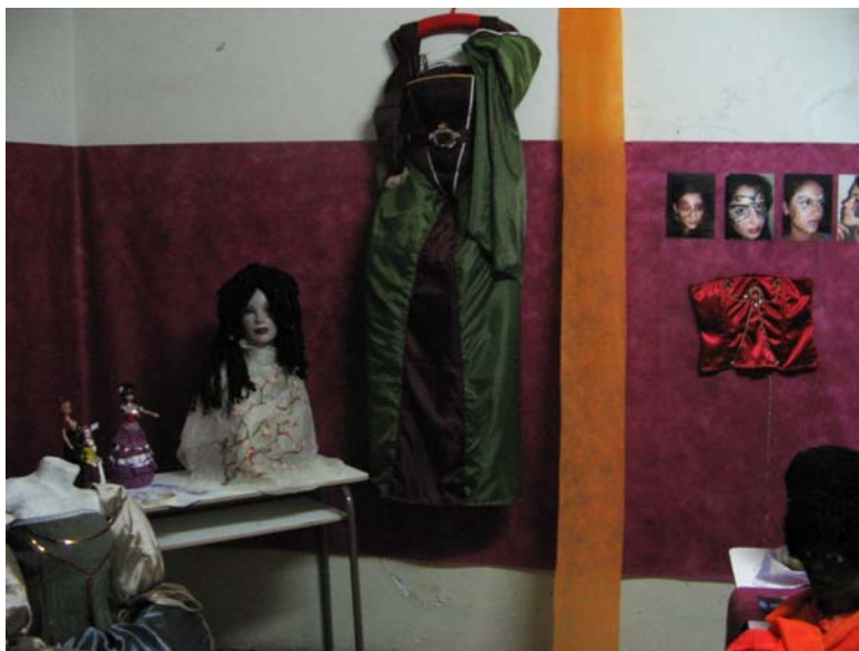
Vestuario (Segunda Muestra de las Artes Escénicas 2007)